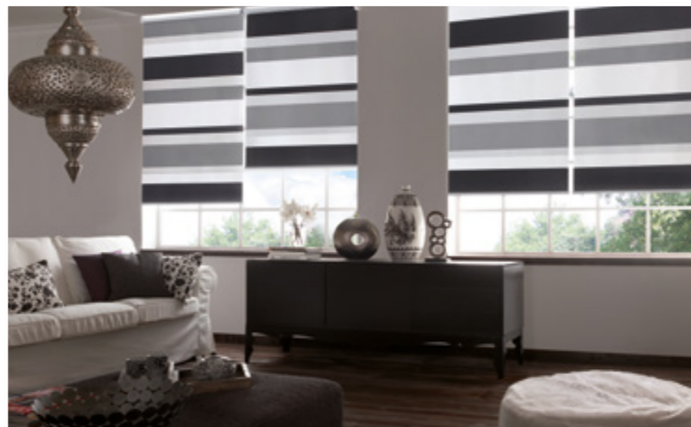
Foto- und Werberollos

Ob für das Kinderzimmer oder im Schaufenster Ihres Geschäftes, die neuen winmedia® Foto- und Werberollos von WIDMER haben vielfältige Einsatzgebiete.